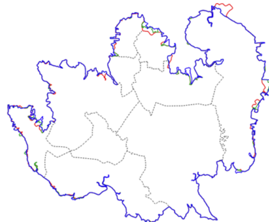
Gambar 2. Hasil Overlay