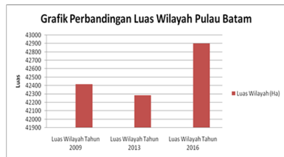
Gambar 4. Perbandingan Luas Wilayah Pulau Batam

Berdasarkan hasil analisis data dan peta perubahan garis pantai di Pulau Batam, perubahan garis pantai yang terjadi berdampak pada perubahan luas wilayah daratan Pulau Batam pada tiga tahun yang berbeda. Perubahan luas wilayah Pulau Batam yang signifikan terjadi dari tahun 2013 sampai tahun 2016. Hasil perbandingan luas wilayah di Pulau Batam akibat dampak perubahan garis pantai pada tahun yang berbeda yaitu 2009, 2013, dan 2016 disajikan seperti pada Gambar 4.