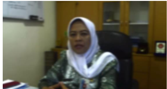
Gambar 2 Cross Dissolve Transition