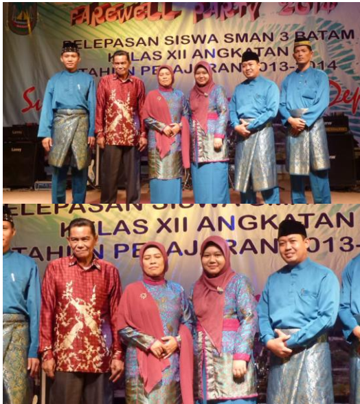
Gambar 1 Image panning and zoom

Pergerakan gambar dengan menggunakan teknik panning membuat gambar seolah-olah bergerak dari kanan ke kiri atau dari atas ke bawah maupun zoom in dan zoom out .