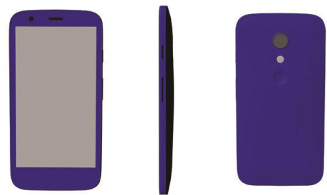
Gambar 2 Desain Telepon Seluler

Telepon seluler digunakan oleh pemuda juga memiliki warna biru yang menandakan bahwa telepon seluler ini milik si pemuda.