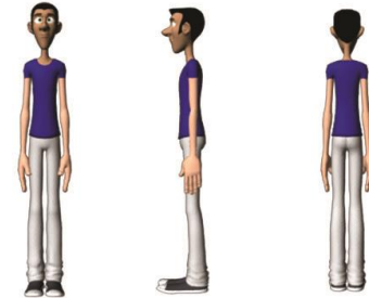
Gambar 1 Desain Karakter

Karakter disini adalah seorang pemuda berumur 23 tahun dan menyukai warna biru. Warna biru dipilih untuk menunjukkan warna elegan. Karakter ini dipilih sebagai representasi dari masyarakat.