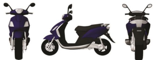
Gambar 3 Desain Sepeda Motor

Sepeda motor kesukaan si pemuda diberi warna biru.