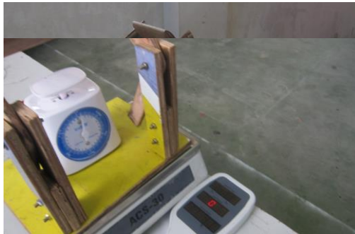
Gambar 5. Neraca (Sistem Mekanik)