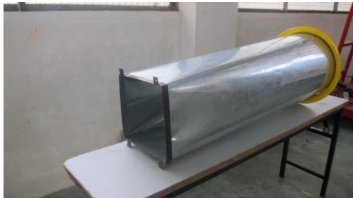
Gambar 4. Diffuser