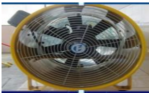
Gambar 6. Blower