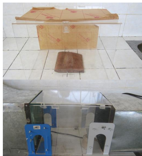
Gambar 2. Seksi Uji